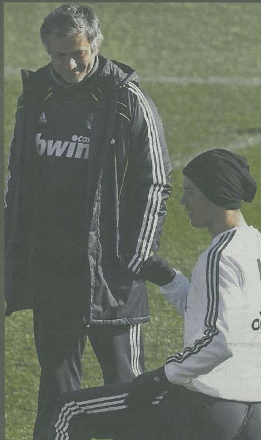
Mourinho y Cristiano Ronaldo antes de viajar a Sevilla